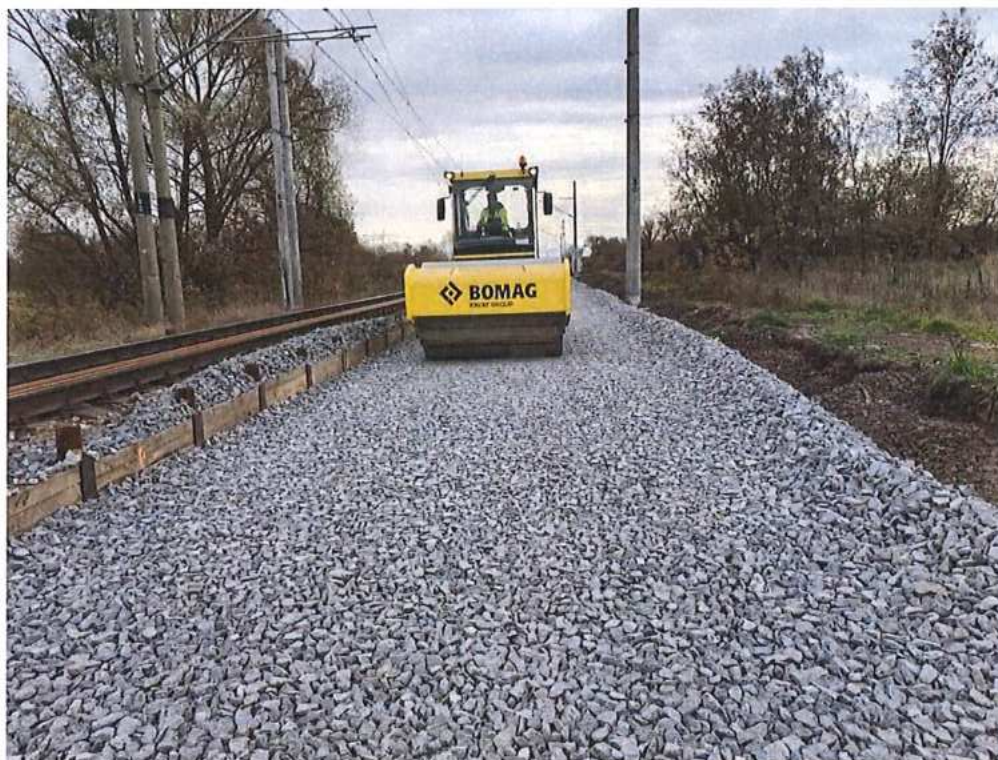
Zriadenie podkladnej vrstvy z kameniva fr. 32/63 - SO 10-32-01