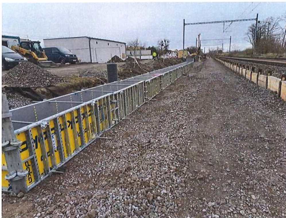
Debnenie a betonáž základu nástupišt'a - SO 11-32-04