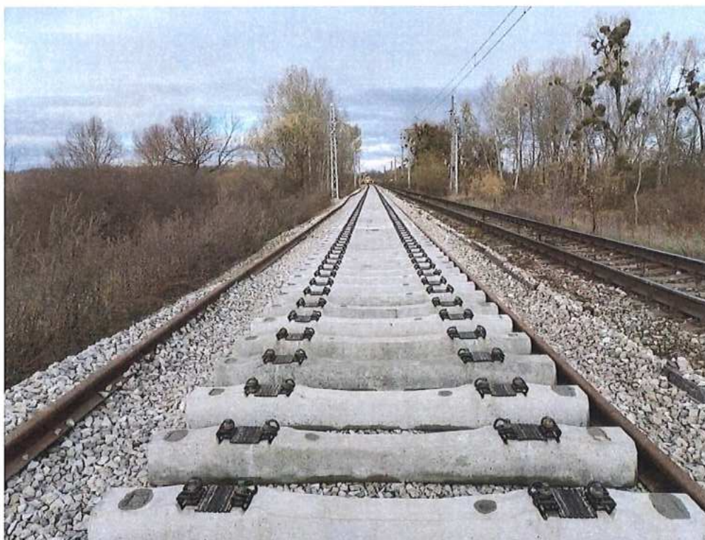
Rozkladanie podvalov a koľajníc - SO 12-32-01