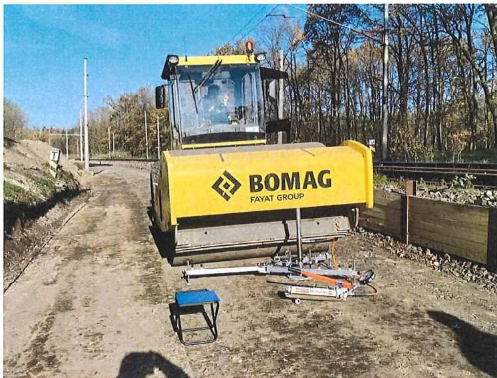
Zemná pláň (stat. zat. skúška) – SO 10 -32-02