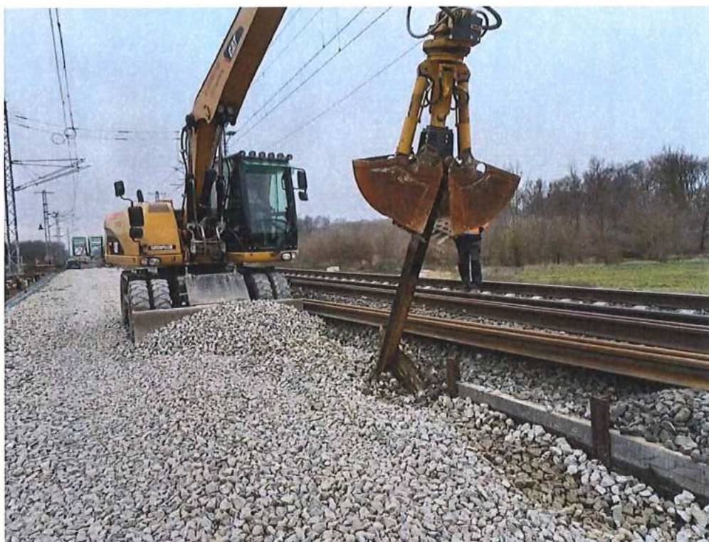
Demontáž paženia - SO 12-32-01