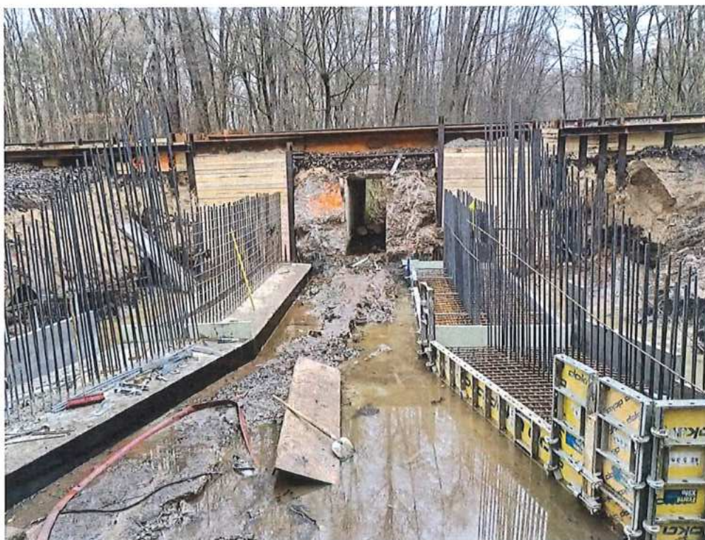
Realizácia priepustu - SO 10-32-05