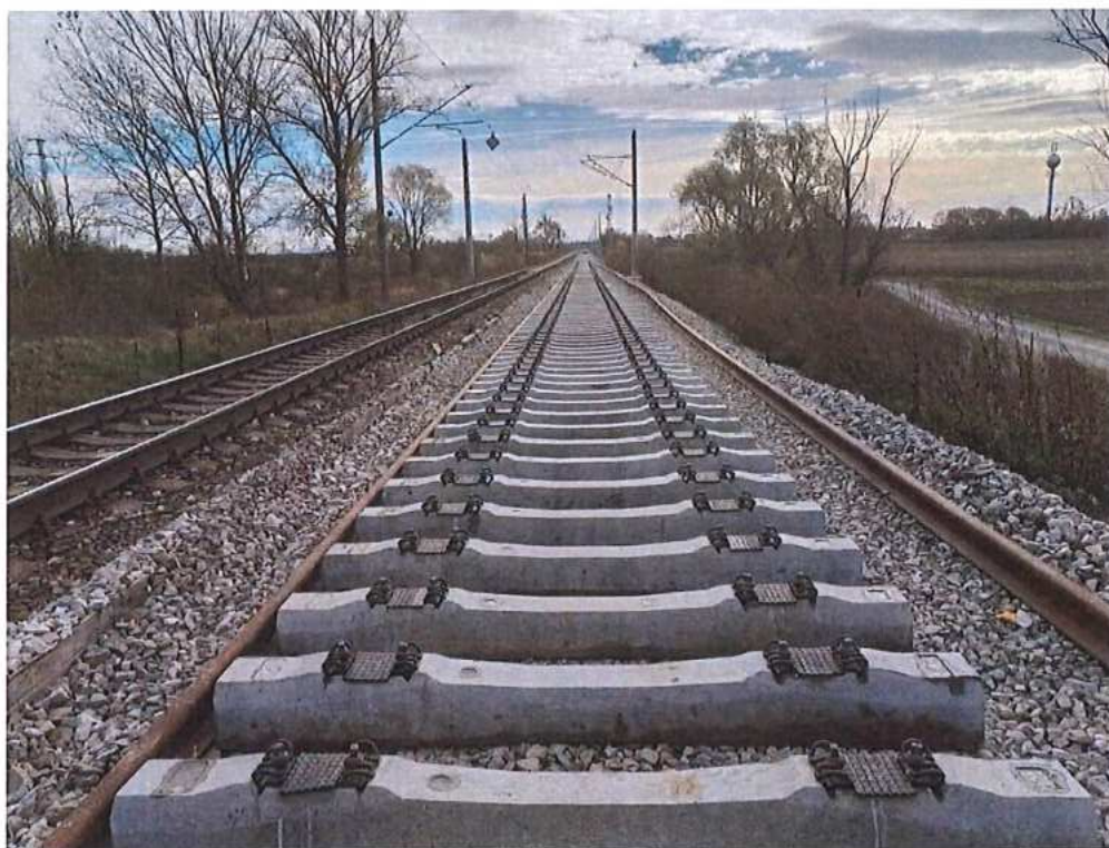
Rozkladanie podvalov a koľajníc - SO 12-32-01