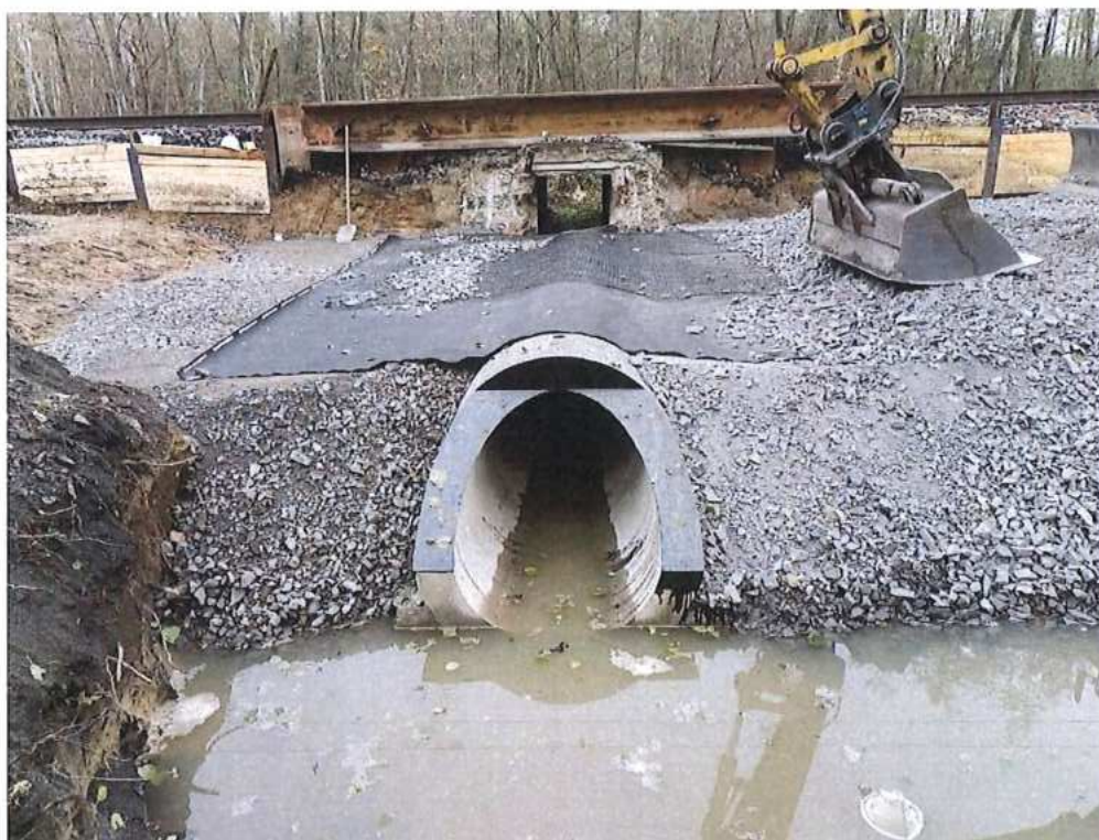
Realizácia priepustu - SO 10-32-07