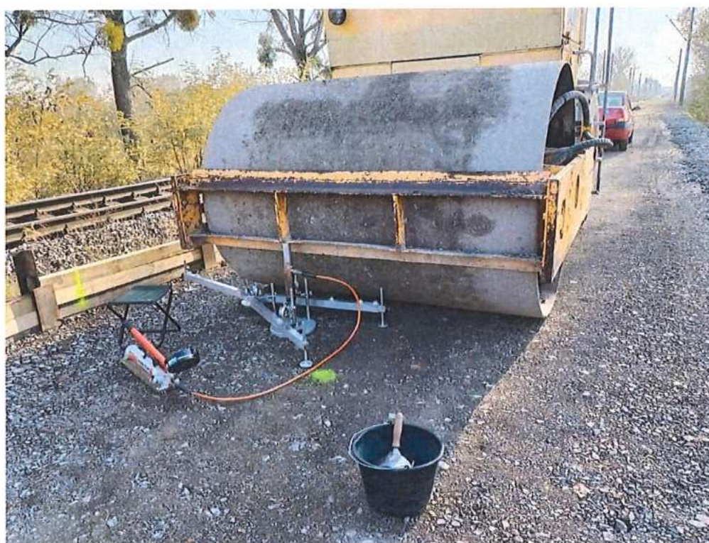
Pláň žel. spodku (stat. zať. skúška) – SO 12 -32-02