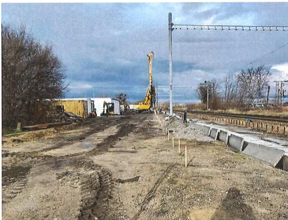
Vŕtanie pilót pre PHS - SO 11-34-04