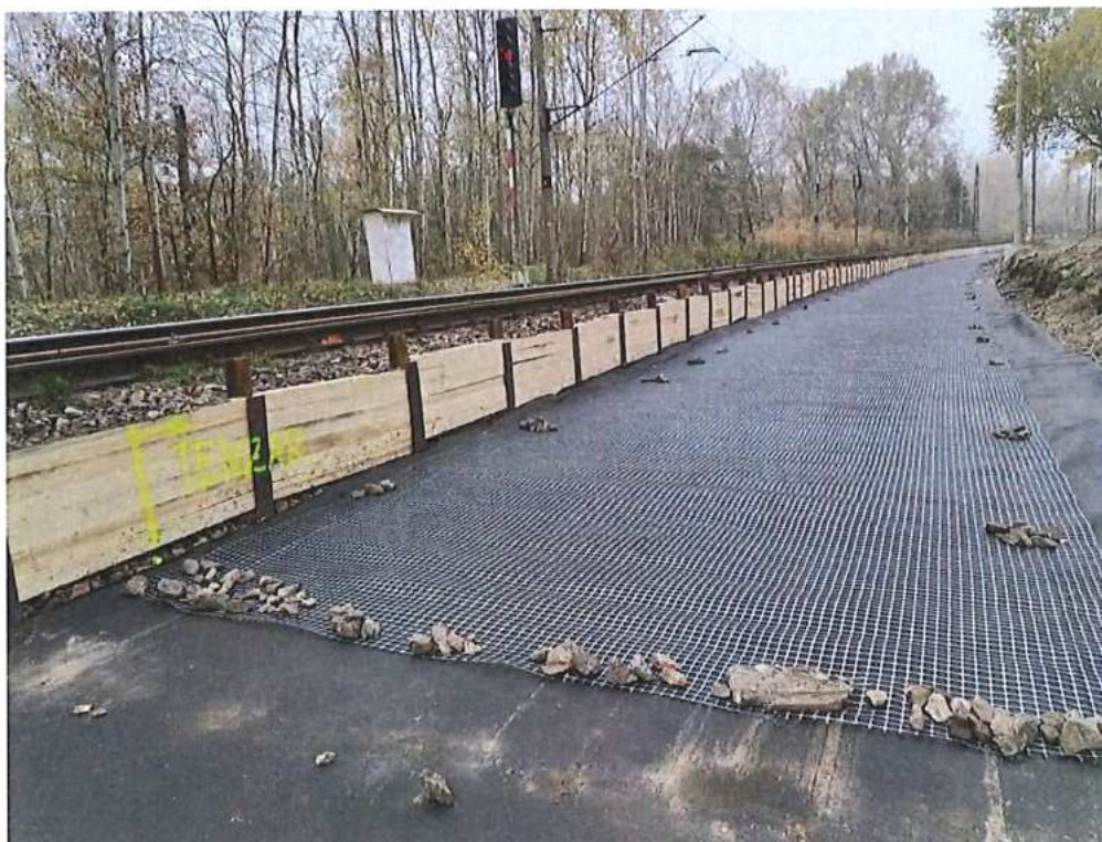
Pláň žel. spodku – SO 10 -32-02