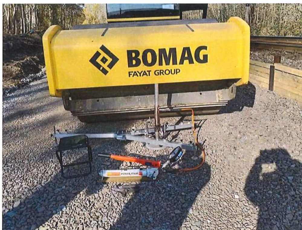
Pláň žel. spodku (stat. zat. skúška) – SO 10 -32-02