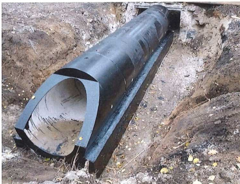
Realizácia priepustu - SO 10-32-06