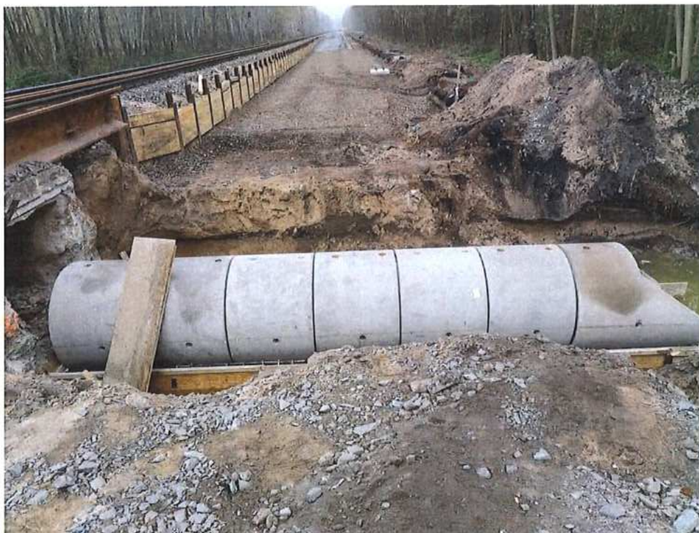
Priepust v nžkm 70,556 (ev.km 70,535) – SO 10-34-07