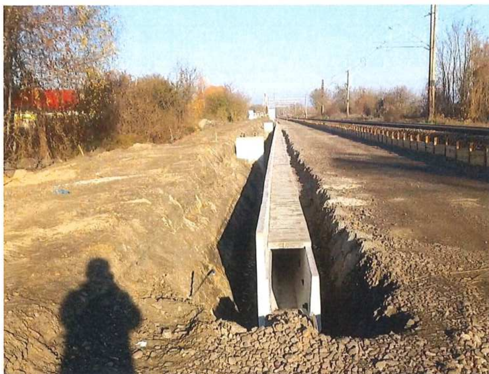
Zriadenie spevnenej priekopy "J" - SO 10-32-02