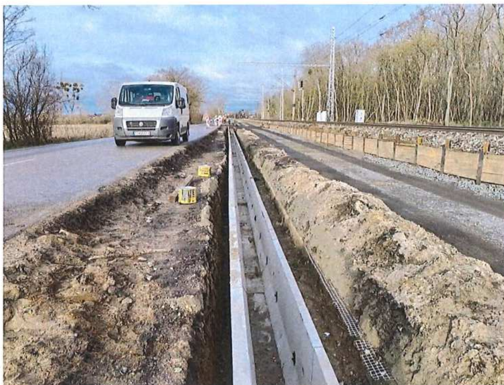
Zriadenie spevnenej priekopy "J" - SO 10-32-02