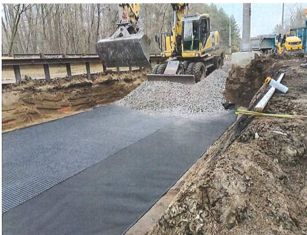
Sypanie prechodových oblastí pri priepuste č.5 - SO 10-32-02