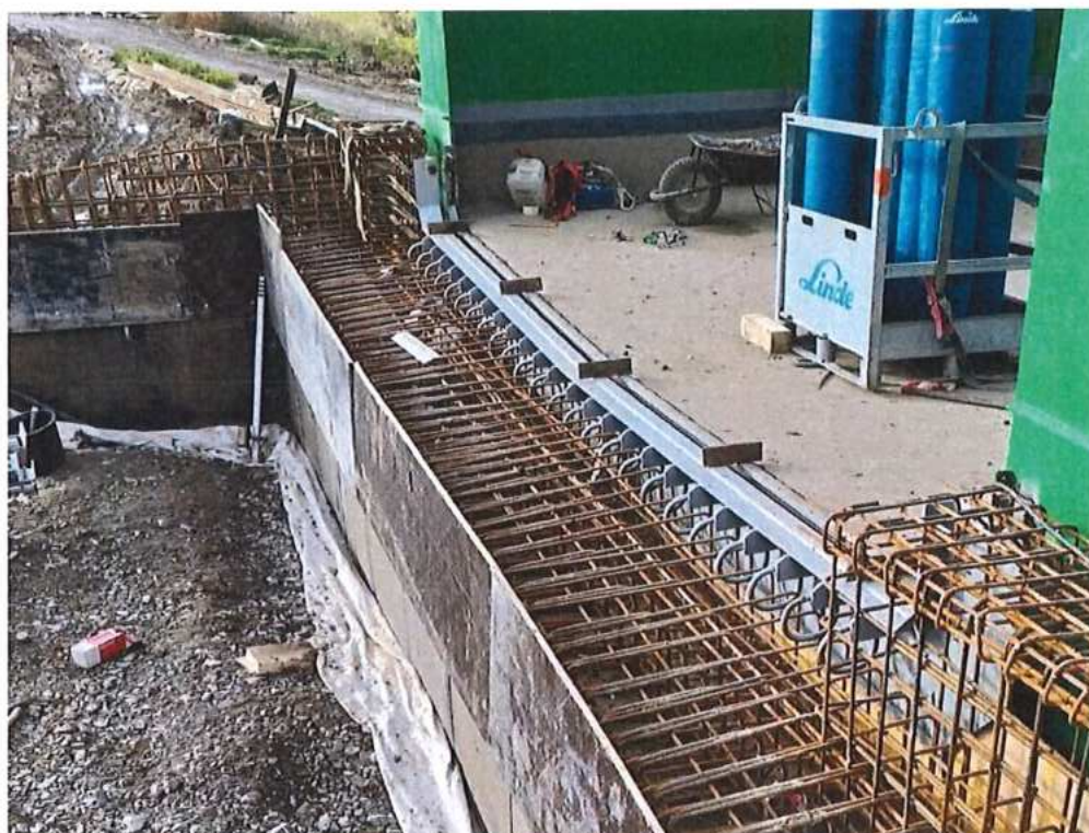
Armovanie a debnenie záverného múrika pri opore č.1 - SO 12-33-04