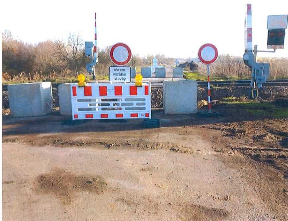
Uzavretie žel. priecestia a cesty III/1129 v obci Brodské