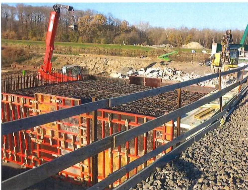
Armovanie a debnenie stien a stropu - SO 12-33-03