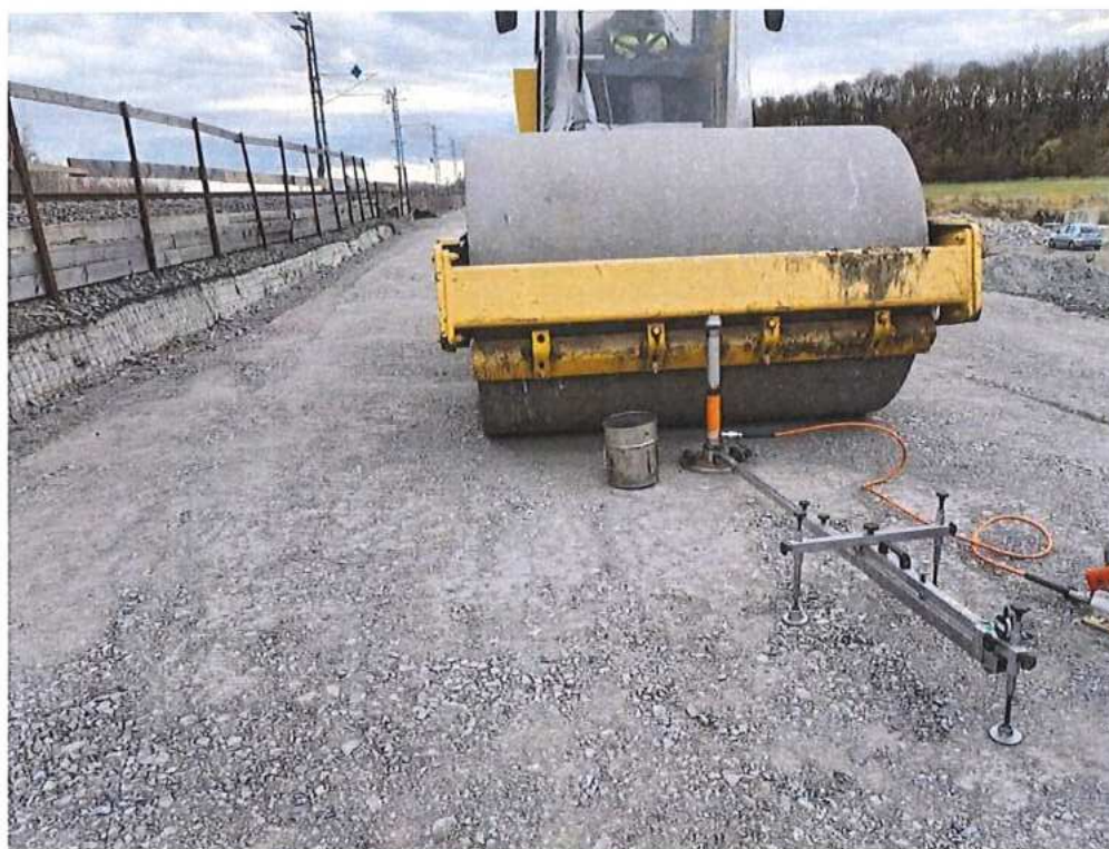
Statická skúška - SO 12-32-02